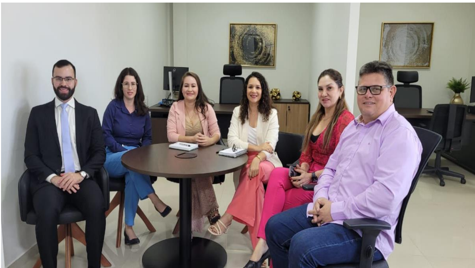
Imagem 02: Reunião com a Procuradoria Geral, Dep. De Licitação e Planejamento da Casa.