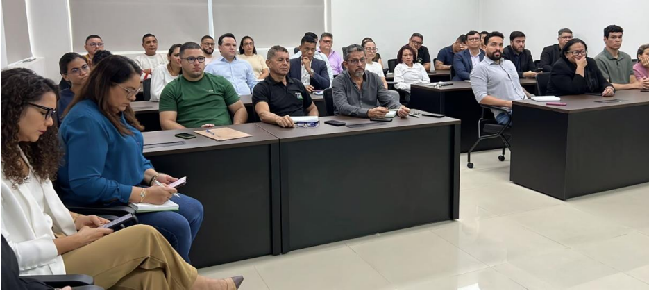
Imagem 01: Reunião de Alinhamento com os servidores da casa Legislativa